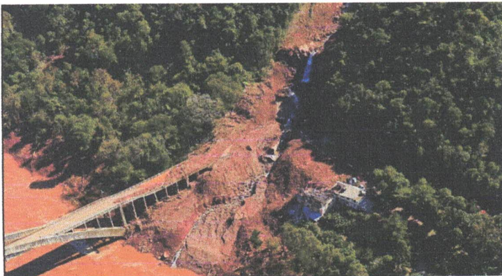
Imagem da Ponte Ernesto Dornelles - município de Veranópolis