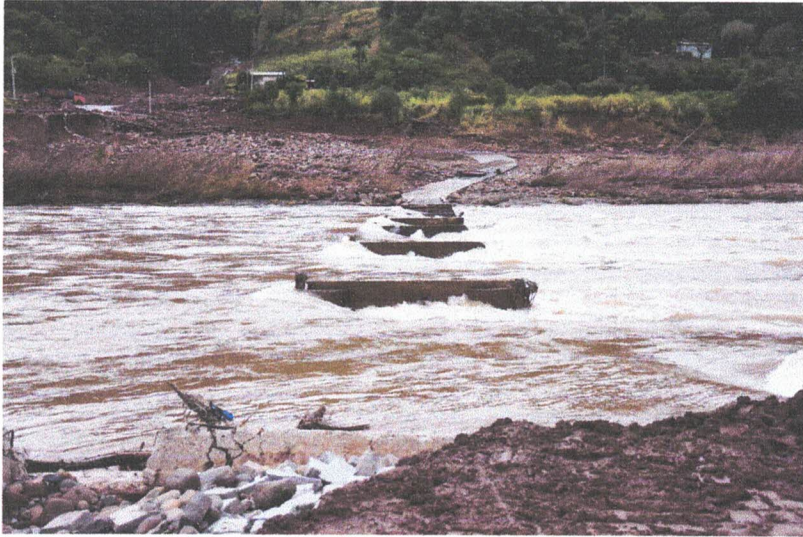
Imagem dos destroços da ponte sobre o Rio das Antas que liga Cotiporã a Bento Gonçalves