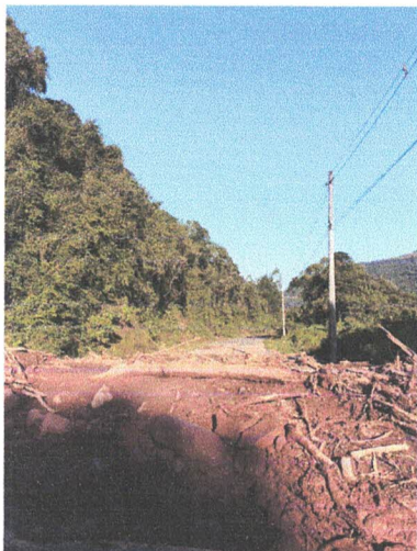
Imagem da estrada Bento Gonçalves próximo a Ponte sobre o Rio das Antas