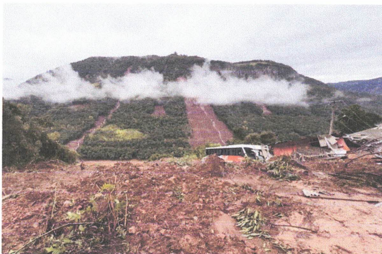
Imagem da Serra das Antas que liga Veranópolis a Bento Gonçalves