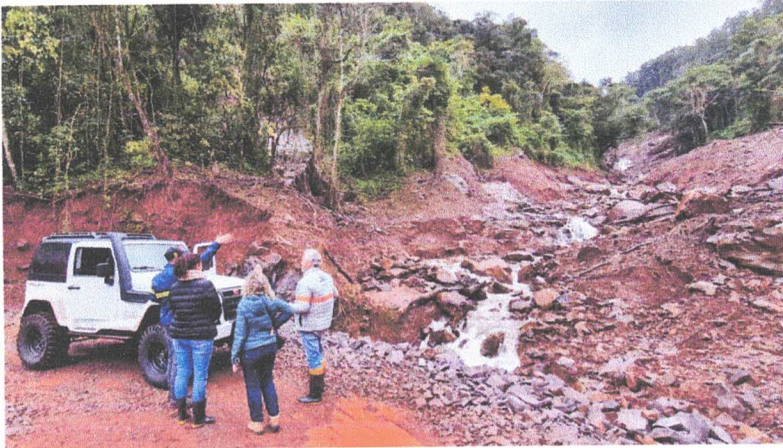
Imagem do interior de Cotiporã