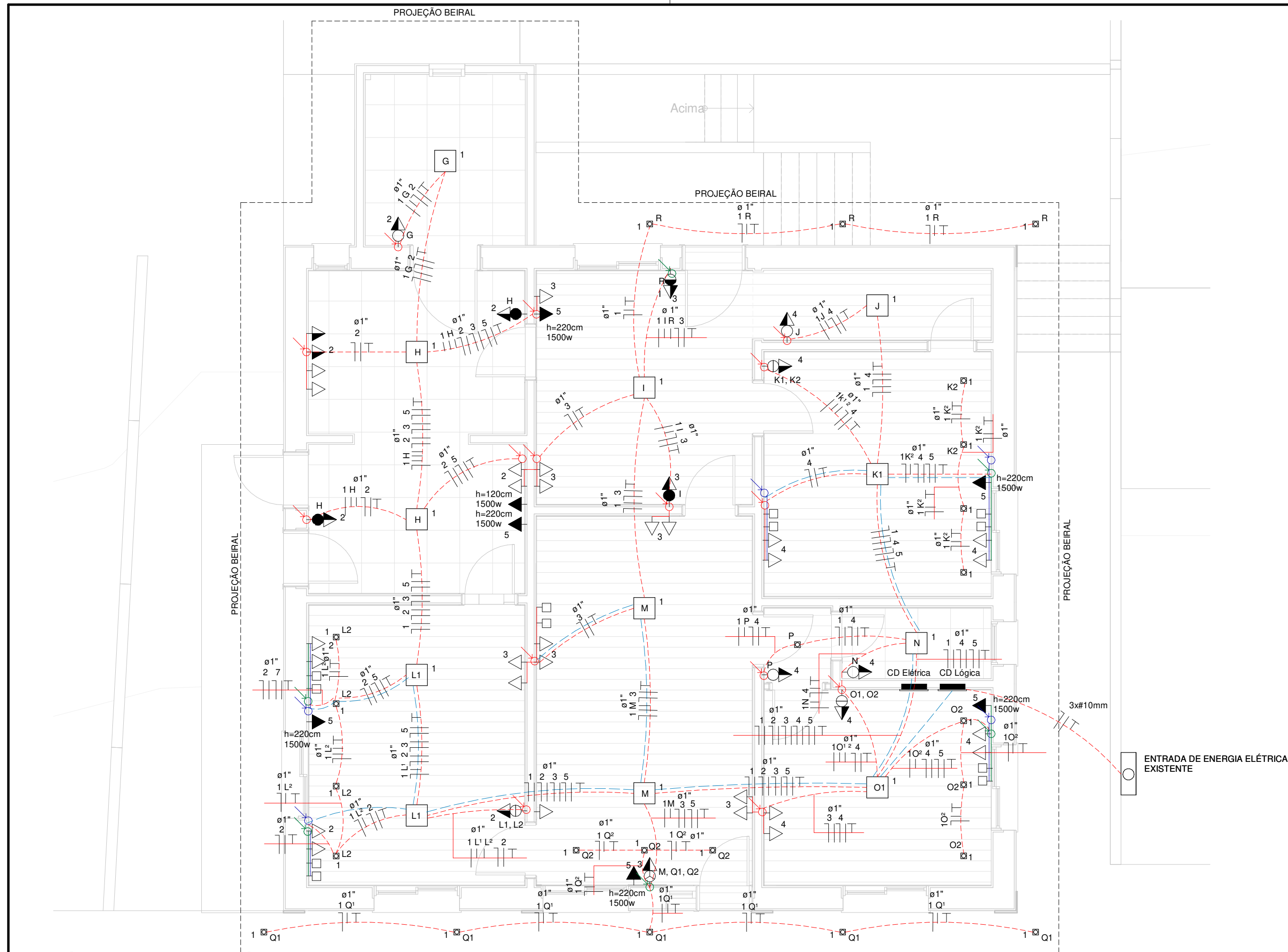
ELÉTRICO - PAV. TERREO ESCALA 1 : 50