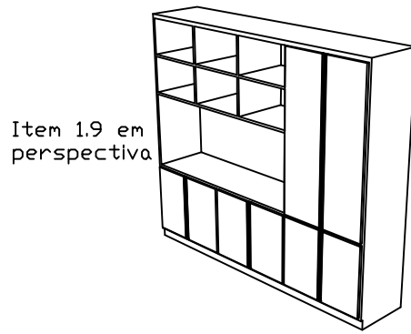
Item 1.9 - Armário

*Aberturas de acordo com a representação em 3D.