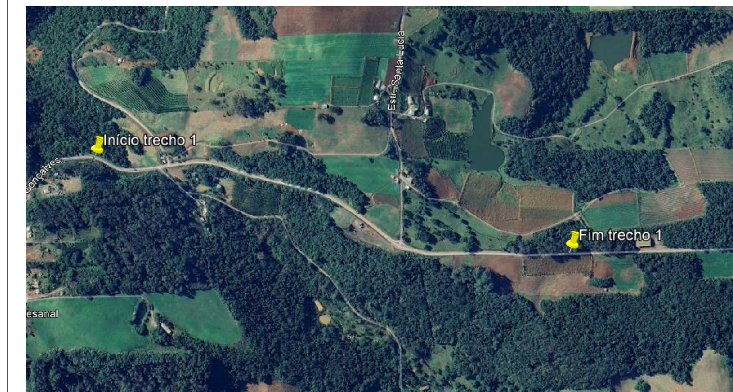
Localização Trecho 1 - 0+820 a 1+460

Trecho com varias patologias, fazer a fresagem e recapeamento de todo trecho.