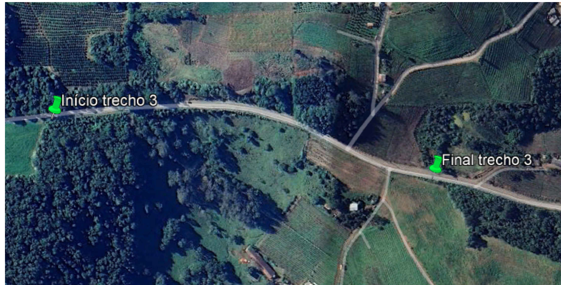
Localização do Trecho 3 - 2+010 a 2+600 Sem escala