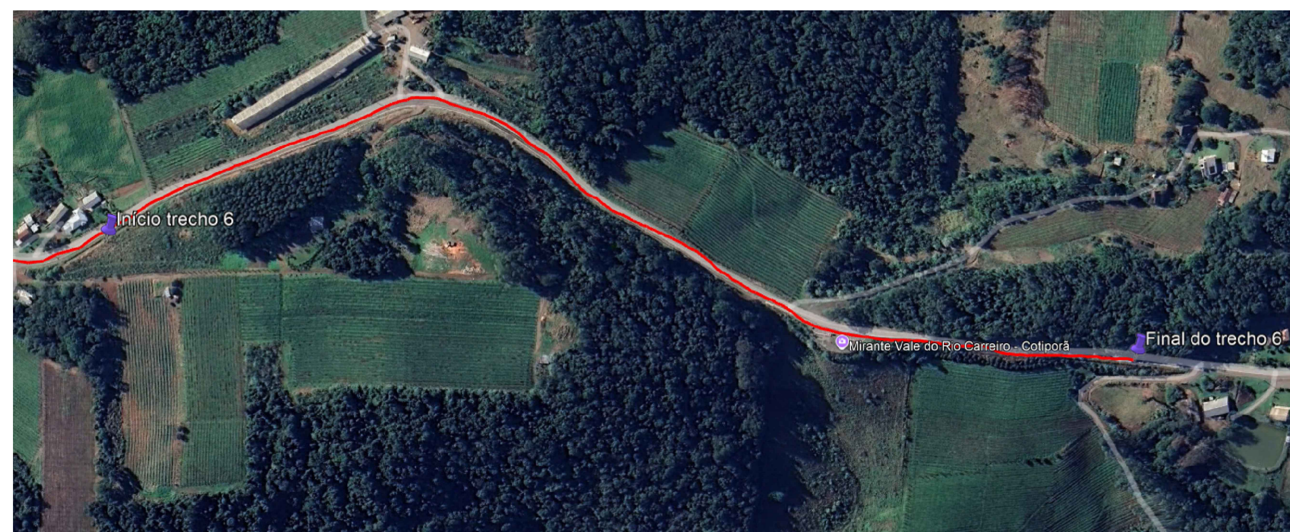
Localização Trecho 6 - 4+520 a 5+473 Escala 1/1000