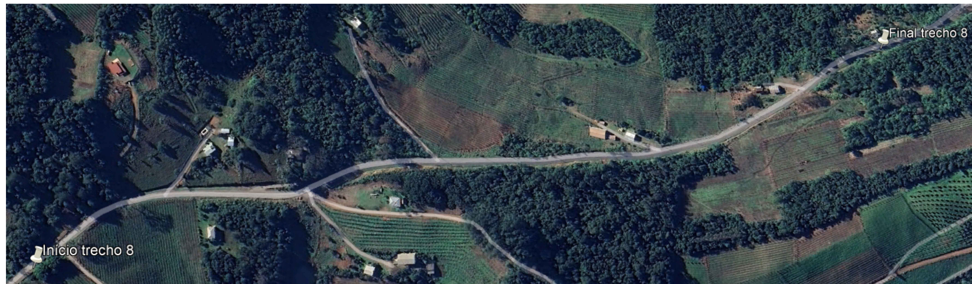
Localização Trecho 8 - 5+860 a 7+100