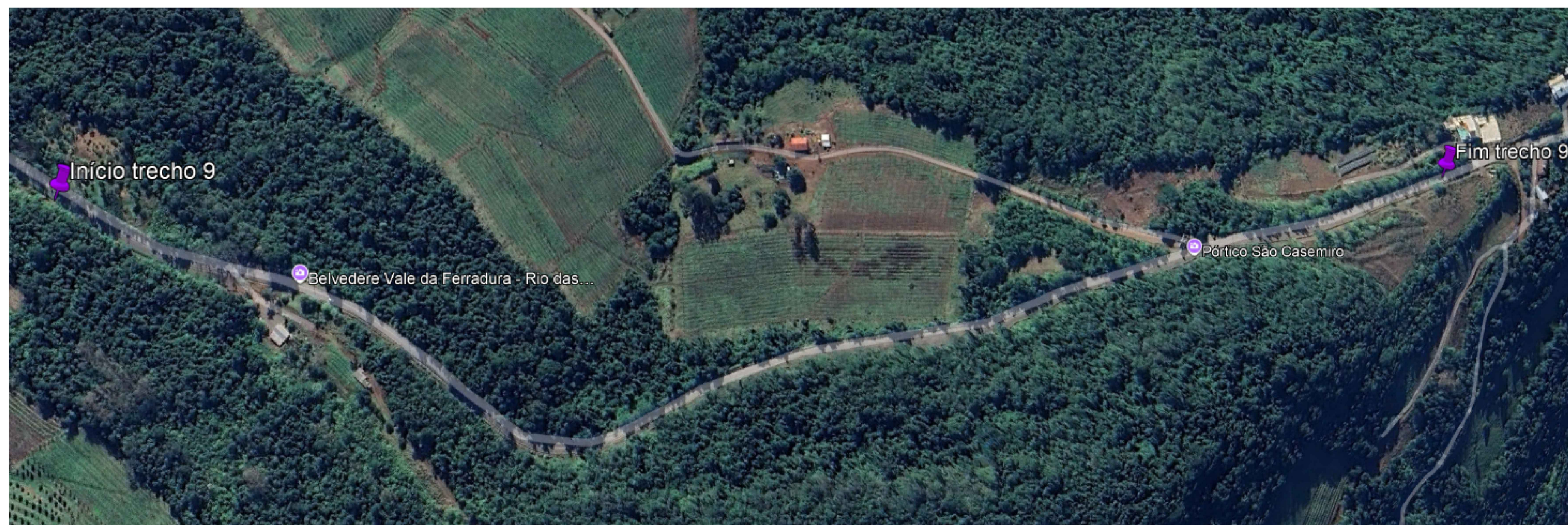
Localização Trecho 9 - 7+980 a 8+200

Trecho com diversas patologias. Fazer a Fresagem e Recapeamento de todo trecho