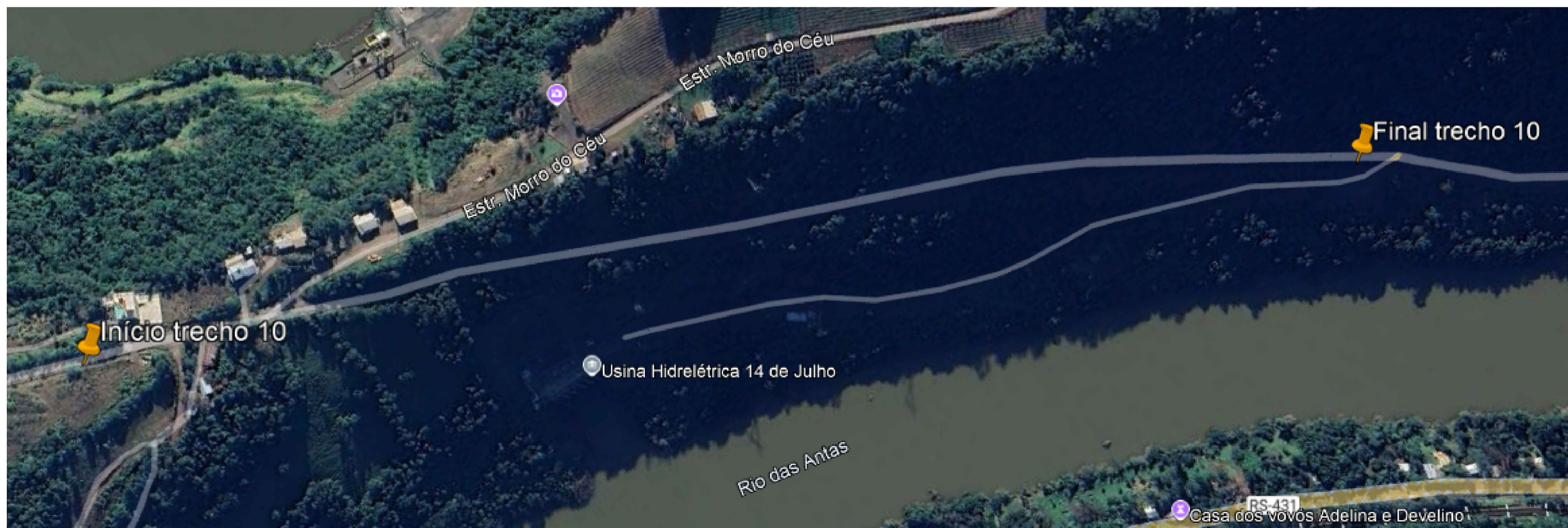
Localização Trecho 10 - 8+200 a 9+200