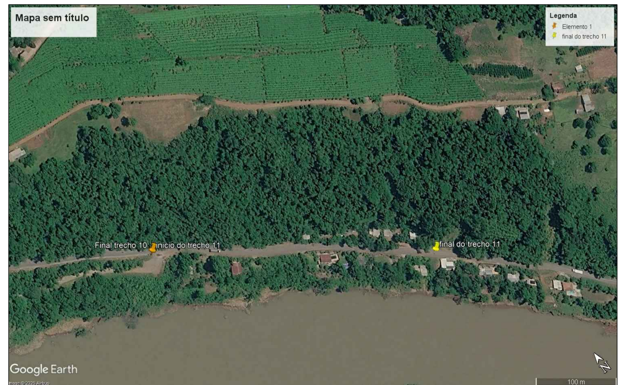
Localização Trecho 11 - 9+200 a 9+550